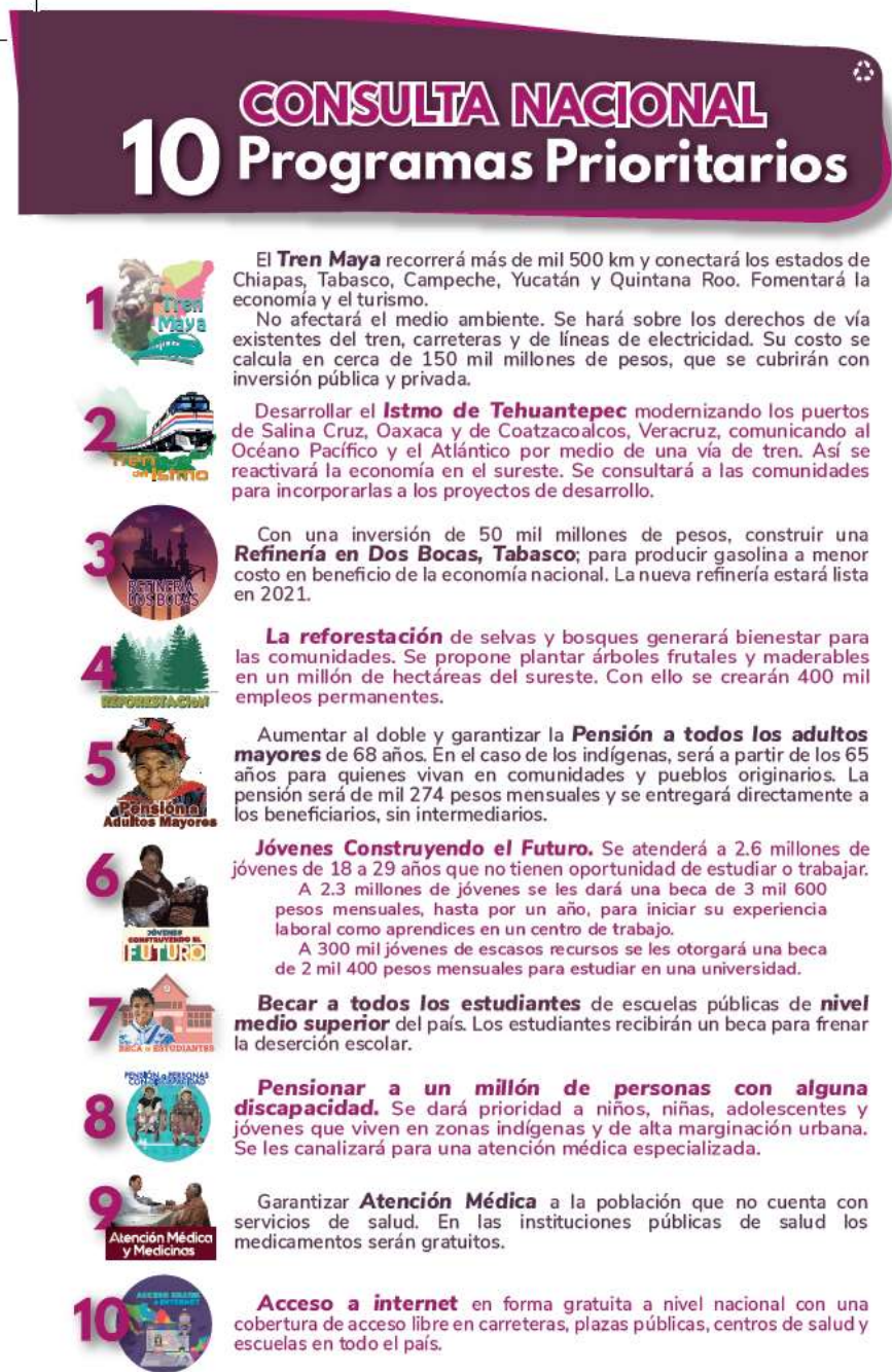
Imagen 1. Boleta que se usará durante la segunda consulta, 24 y 25 de noviembre de 2018