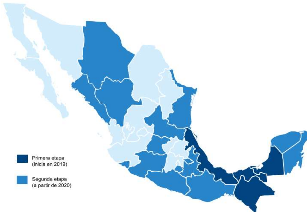
Mapa 1. Cobertura estatal del programa "Sembrando vida"

En 2020 iniciará la segunda etapa que incluirá además a los estados de: Colima, Chihuahua, Durango, Guerrero, Hidalgo, Michoacán, Morelos, Oaxaca, Puebla, Quintana Roo, San Luis Potosí, Sinaloa, Tamaulipas, Tlaxcala y Yucatán, para sumar en total 19 entidades que beneficiarán en total a 400 mil campesinos y abarcará un millón de hectáreas (Yañez, 2018).